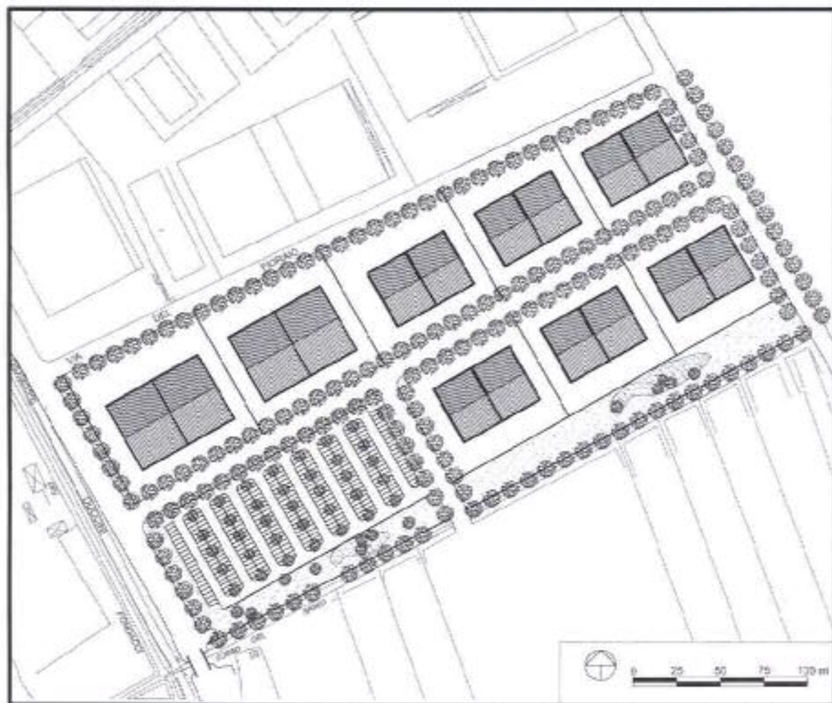
SCHEMA DI ASSETTO TIPOMORFOLOGICO